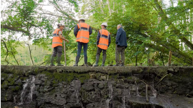
Photo avant travaux (présence de renards hydrauliques sur le seuil)