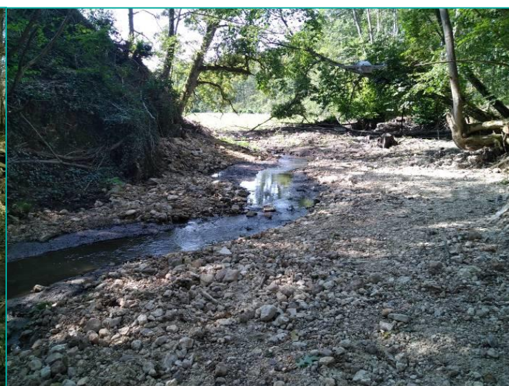
Photo après travaux à l'emplacement du déversoir

Vidéo des travaux : https://www.youtube.com/watch?v=6wzDYhEKi4s