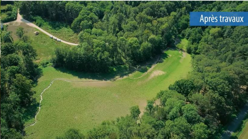
Photo après travaux (la rivière retrace son lit, une prairie humide s'installe)