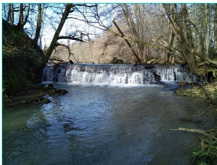
Photo du déversoir avant travaux

L'amont de l'étang est occupé par un boisement humide d'environ 8 000m 2 induit par la présence de l'étang. Le caractère humide de ce site doit perdurer après les travaux de restauration de la continuité écologique (RCE) de l'étang. Un suivi piézométrique a donc été mis en place.